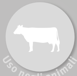
Uso negli animali

Gli antibiotici sono spesso utilizzati in modo inappropriato o senza una reale necessità, sia in ambito umano che veterinario. Migliorare l'uso degli antibiotici è la cosa più importante da fare per rallentare sensibilmente l'emergenza e la diffusione dei batteri resistenti agli antibiotici.