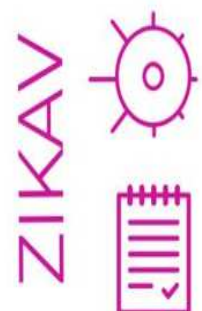
Tab. 6— Distribuzione casi confermati infezione ZIKAV per provincia di domicilio

Tempi di segnalazione: entro le 12 ore dal sospetto diagnostico al Servizio di Igiene e Sanità Pubblica dei Dipartimenti di Prevenzione dell'AULSS competente per territorio -> immediatamente alla Regione