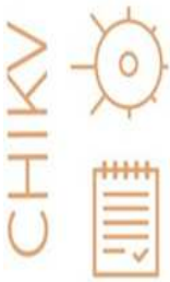
Tab. 4 — Distribuzione casi confermati febbre Chikungunya per provincia di domicilio

Tempi di segnalazione: entro le 12 ore dal sospetto diagnostico al Servizio di Igiene e Sanità Pubblica dei Dipartimenti di Prevenzione dell'AULSS competente per territorio -> immediatamente alla Regione