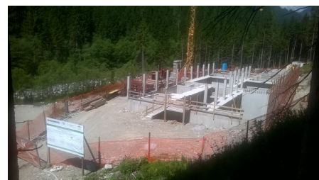
Cantiere in data 2 luglio 2015

Tutto l'impianto è contenuto in un edificio a monoblocco completamente chiuso e coperto, ben inserito nel contesto paesaggistico circostante. Le opere sono state ultimate il